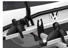
seitlich verschiebbare Schienen

Stehen die Fahrräder auf den einfach einstellbaren, seitlich verschiebbaren Schienen, werden sie durch die Radhalter mit Ratschenfunktion und den abschließbaren Thule AcuTight-Fahrradhaltern schnell und sicher befestigt. Um diese Sicherheit zu gewährleisten, wurde der Träger extremen Belastungstests unterzogen; Gewicht 12,4 kg.