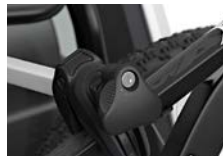
abschließbare Thule AcuTight-Fahrradhalter

Heckträger für den VW T6 Minivan, der dank seiner speziellen Anpassung an die Heckklappe des VW T6 schnell und einfach zu montieren ist. Mit dem Thule WanderWay können 2, durch Nutzung der optional erhältlichen Erweiterungssets bis zu 4 normale Fahrräder transportiert werden, alternativ kann die robuste Konstruktion auch zwei E-Bikes tragen. Die maximale Tragfähigkeit liegt bei 60 kg. Bei der Entwicklung des Thule WanderWay stand die Benutzerfreundlichkeit im Fokus. So kann der Kofferraum ohne montierte Fahrräder mühelos geöffnet werden. Einmal montiert, kann der Thule WanderWay problemlos auch über einen langen Zeitraum auf dem Auto bleiben, durch die erhöhte Position des Trägers bleiben Rücklichter und Kennzeichen frei.