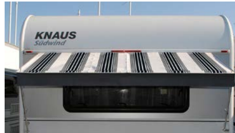
Trento I Material: 100 % Acryl, Maße (B x T): 180 x 80 cm; Gewicht: 0,8 kg 071/006