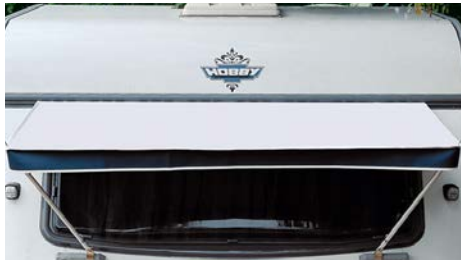
Shadow Material: 100 % PVC Polyvinylchlorid, Maße (B x T): 180 x 70 cm; Gewicht: 1,1 kg 071/009

Das universelle Markisengestänge aus \varnothing 19/16 mm Aluminiumrohr ist teleskopierbar. Für Markisen bis 2 m Breite. Befestigung in der Kederchiene und an den Rangiergriffen. Passend für Bug- u. Heckfenster m. Runderdecken. 610/030