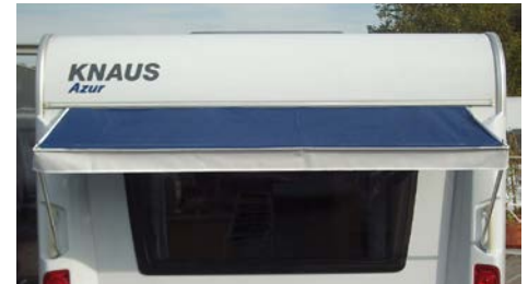
Passau Material: 100 % PES Polyester, mit Polyurethan-Beschichtung, Maße (B x T): 190 x 75 cm; Gewicht: 0,7 kg 070/849-2