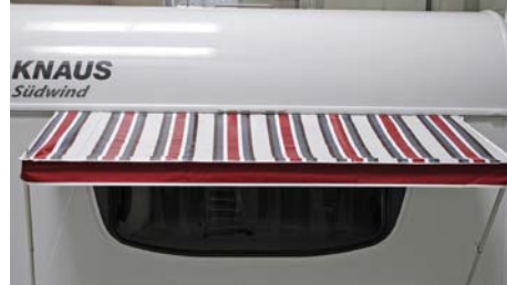
Terra Material: 100 % PVC Polyvinylchlorid, Maße (B x T): 180 x 70 cm; Gewicht: 1,1 kg 071/008