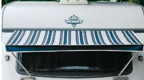
Röhn Material: 100 % PVC Polyvinylchlorid, Maße (B x T): 180 x 70 cm; Gewicht: 1,3 kg 071/004

Zu allen Markisen empfehlen wir das Alu-Gestänge (Art-Nr.: 610/030) mit Befestigungsschellen.