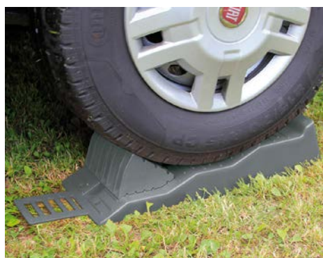
Auffahrkeil Level Pro + Anti Slip Plate + Blockierkeil Chock